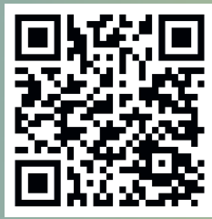
Film zum Vereinsheimneubau