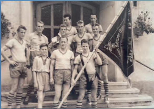
1959 25 Jahre VfL Ostdorf