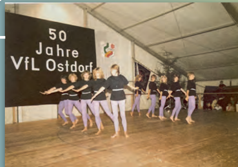
1984 50 Jahre VfL Ostdorf