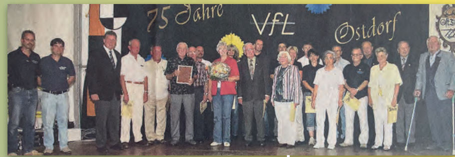
2003 Neues Sportangebot: „Gesundheitskurse beim VfL“