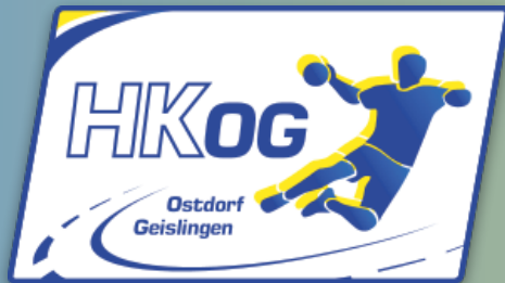
2011 1. Berolino Jugend Handball Cup