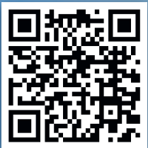
Film zum Berolino Cup 24